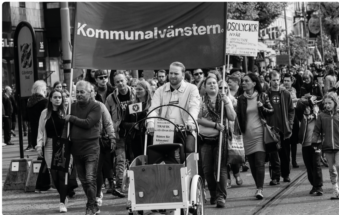
Inom Vänsterpartiet växer det fram olika branschföreningar. Kommunalvänstern är en av dem.

Kan vi även få till reglering av gruppstorlekar och nyckeltal med maxantal elever per lärare vore det ännu bättre!