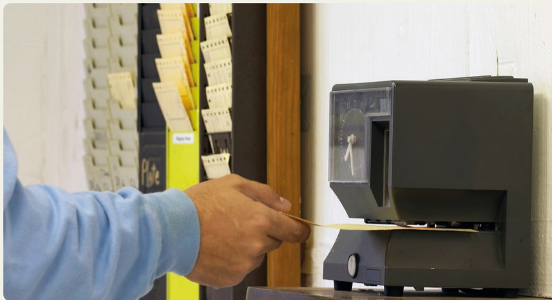
Stämpeluret är knappast modernt längre – precis som 40-timmars arbetsveckan, som infördes för hela 55 år sedan.

Få frågor i svensk politik symboliserar en så tydlig vision för framtiden som kravet på en arbetstidsförkortning. För oss i Vänsterpartiet handlar det om mer än att bara minska antalet timmar vi spenderar på jobbet – det handlar om att skapa ett samhälle där jämlikhet, hälsa och hållbarhet står i centrum.